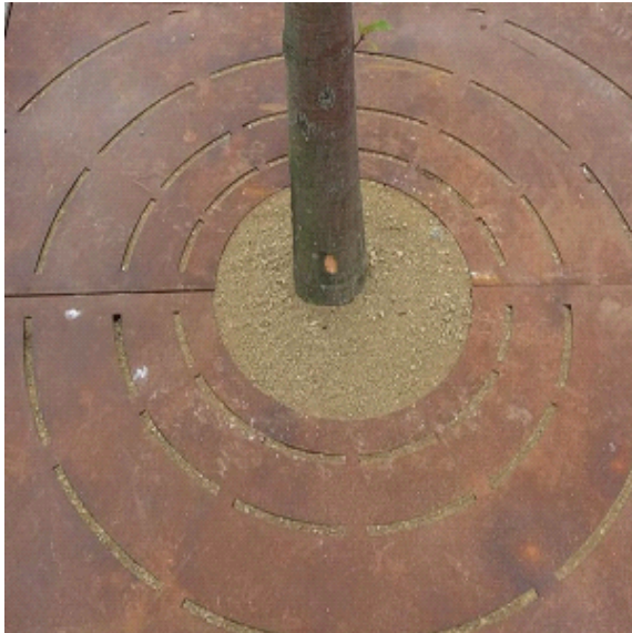
Jogefix voor onkruidvrije boomspiegels

Jogefix is een natuurlijke halfverharding, die in combinatie met een behandeling met CitySlim zorgt voor onkruidvrije verharding van boomspiegels in bestrating en in gazons. Onkruid krijgt geen kans, de boom wordt niet gehinderd in zijn groei en maaierwerkzaamheden kunnen snel, zonder aanvullende hulpmiddelen, uitgevoerd worden.