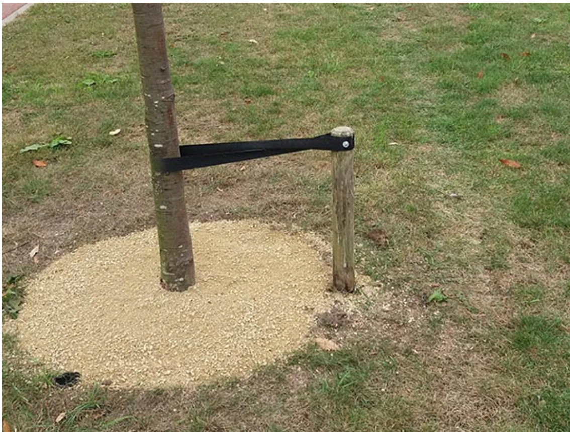
Onkruid onder controle en onderhoudsvriendelijk met Jogefix en CitySlim