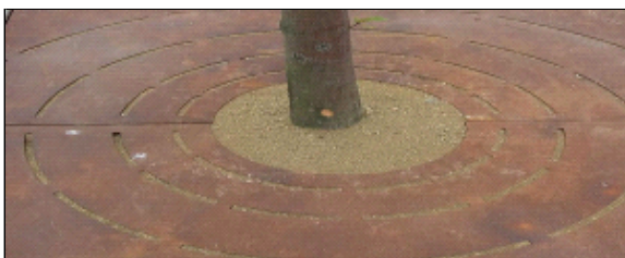
Jogefix voor onkruidvrije boomspiegels