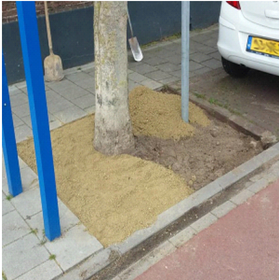
Stap 1 - Jogefix natuurlijke halfverharding verdelen op ondergrond

U kunt Jogefix laten aanbrengen door een door PVN geadviseerd bedrijf. Zelf aanbrengen is echter eenvoudig; zie onderstaande verkorte instructie. Voor een uitgebreide gebruiksaanwijzing of verwerkingsvoorschrift kunt u contact opnemen via www.pvnbestratingsvoegen.nl/contact .