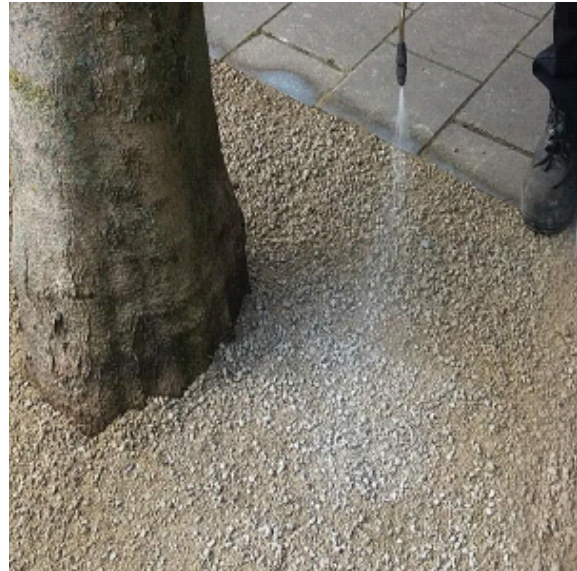
Stap 2 - Aanbrengen van de CitySlim coating