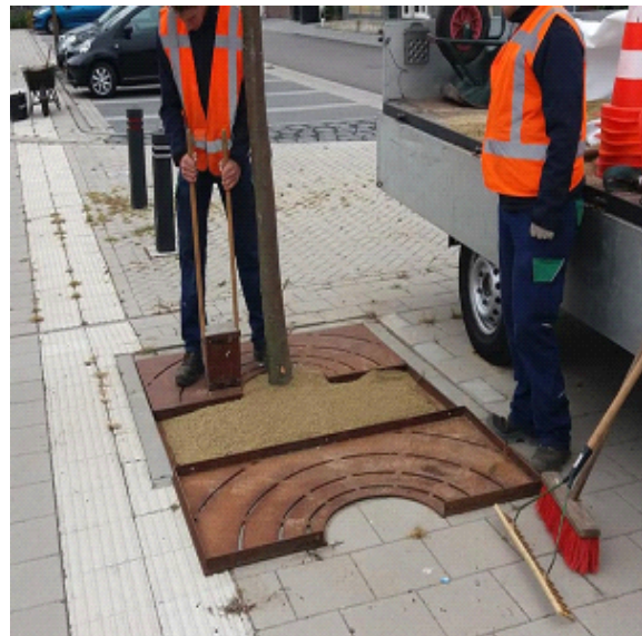
Stap 3 - Toepassen van stalen boomroosters indien gewenst

Hoewel PVN Bestratingsvoegen de werking van Jogefix onderschrijft, is op dit product onze vijf jaar garantie niet van toepassing.