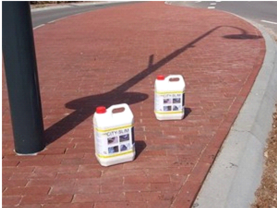
Stap 1 - Invegen met voegzand, aantrillen (eventueel herhalen)

CitySlim is geschikt voor voegbreedtes van 0 tot 3 mm en kan ook in combinatie met Jogefix worden verwerkt. U kunt CitySlim laten aanbrengen door een door PVN geadviseerd bedrijf. Zelf aanbrengen is echter eenvoudig; zie onderstaande verkorte instructie. Voor een uitgebreide gebruiksaanwijzing of verwerkingsvoorschrift kunt u contact opnemen via www.pvnbestratingsvoegen.nl/contact .