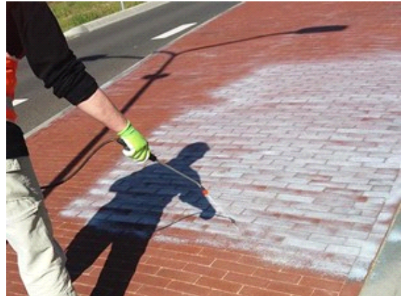
Stap 2 - City-Slim aanbrengen tot de voegen en het oppervlak volledig verzadigd zijn