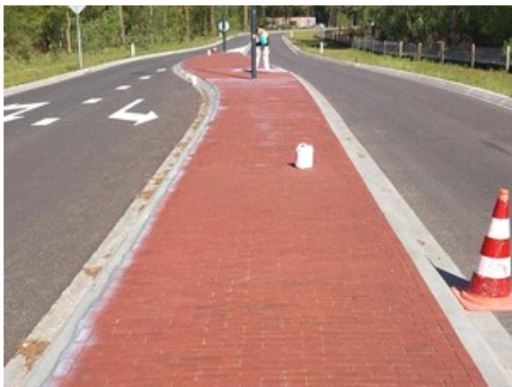
Stap 3 - Verwijder overtollig product met trekker

Hoewel PVN Bestratingsvoegen de werking van CitySlim onderschrijft, is op dit product onze vijf jaar garantie niet van toepassing. Kiest u liever voor een garantie van 5 jaar op onkruidvrije bestrating, dan is CityPro 1000 Next Gel zeer geschikt.