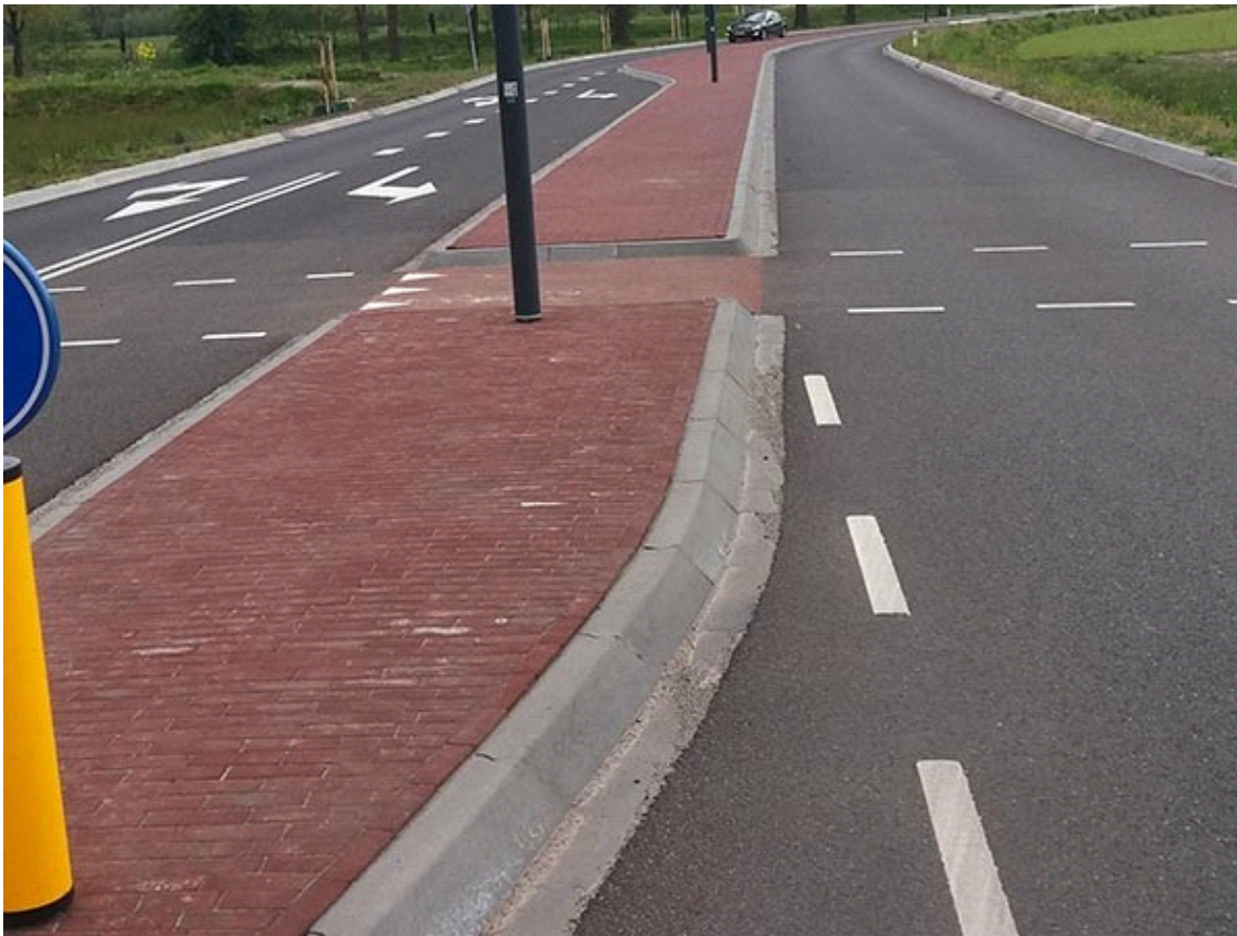
Middengeleiders onkruidvrij met CitySlim

Ga naar www.pvnbestratingsvoegen.nl voor meer informatie, advies en bestekteksten.