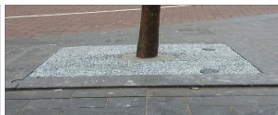
Na behandeling met CityKrans