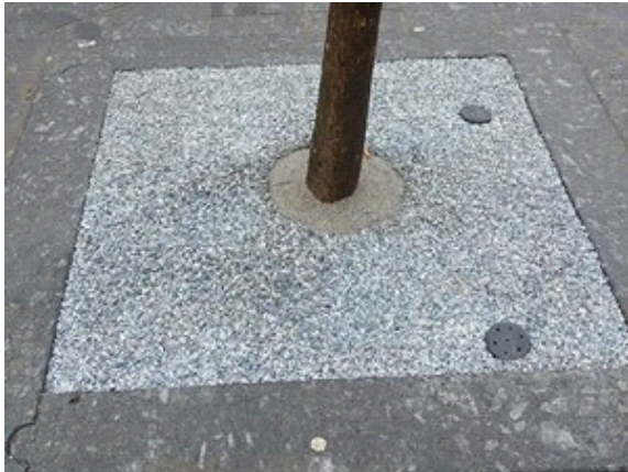
Stap 1 - Zorg voor een stabiele ondergrond voor een goed eindresultaat

Laat CityKrans aanbrengen door een door PVN geadviseerd bedrijf voor 5 jaar garantie tegen onkruid. Het product laat zich echter eenvoudig aanbrengen, zie onderstaande verkorte instructie. Voor een uitgebreide gebruiksaanwijzing of verwerkingsvoorschrift kunt u contact opnemen via www.pvnbestratingsvoegen.nl/contact .