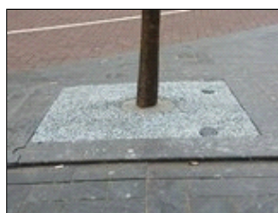
Na behandeling met CityKrans