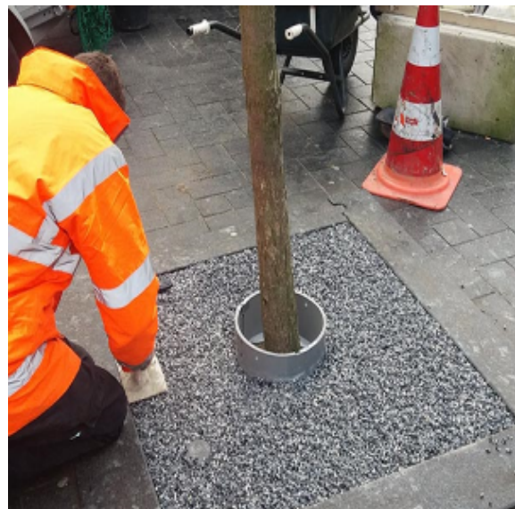
Stap 4 - Egaliseren met een rei of gelijkwaardig

PVN Bestratingsvoegen garandeert de kwaliteit van CityKrans boomspiegelsysteem, mits aangebracht door één van onze verdelers/verwerkers. Kijk voor meer informatie op www.pvnbestratingsvoegen.nl/garantie .