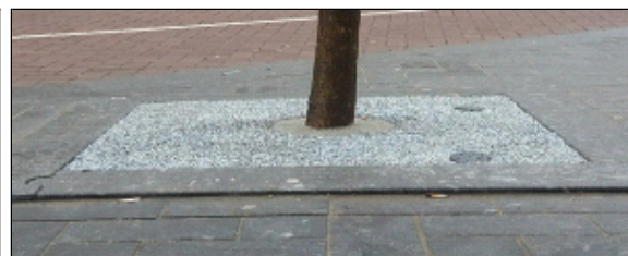
Na behandeling met CityKrans