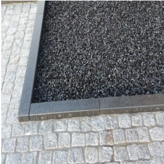
CityKrans als verharding, spatgrind etc

Gemengd met grind of keien wordt CityKrans gebruikt voor waterdoorlatende bekleding rond bomen of waterdoorlatende aaneengesloten bestrating voor voetgangersverkeer (3 cm. laagdikte) of autoverkeer (5 cm. laagdikte).