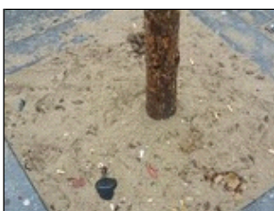
Voor behandeling met CityKrans