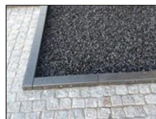
CityKrans als verharding, spatgrind etc