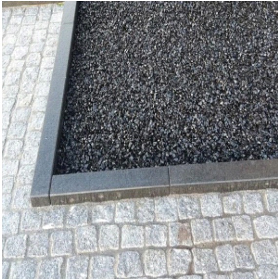
CityKrans als verharding, spatgrind etc

Gemengd met grind of keien wordt CityKrans gebruikt voor waterdoorlatende bekleding rond bomen of waterdoorlatende aaneengesloten bestrating voor voetgangersverkeer (3 cm. laagdikte) of autoverkeer (5 cm. laagdikte).