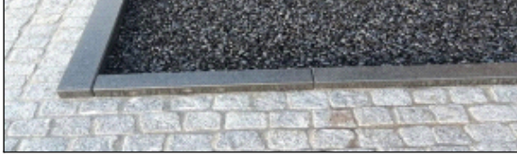
CityKrans als verharding, spatgrind etc