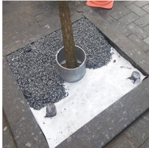
Stap 2 - Homogeen bindmiddel A en B mixen met schoon en droog grind