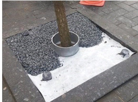
Stap 2 - Homogeen bindmiddel A en B mixen met schoon en droog grind