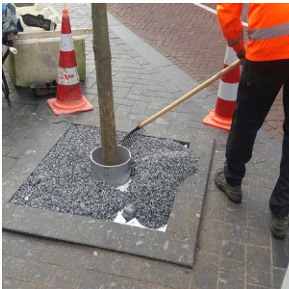
Stap 3 - Pas een meegroeiring toe en de juiste laagdikte