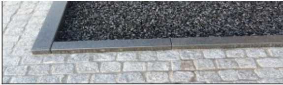
CityKrans als verharding, spatgrind etc