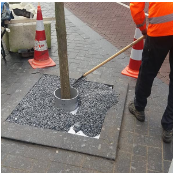
Stap 3 - Pas een meegroeiring toe en de juiste laagdikte