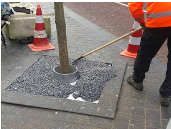
Stap 3 - Pas een meegroeiing toe en de juiste laagdikte