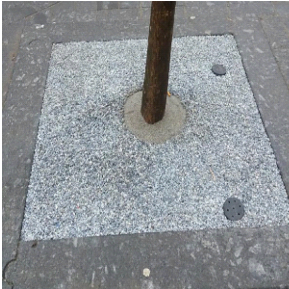
Stap 1 - Zorg voor een stabiele ondergrond voor een goed eindresultaat

Laat CityKrans aanbrengen door een door PVN geadviseerd bedrijf voor 5 jaar garantie tegen onkruid. Het product laat zich echter eenvoudig aanbrengen, zie onderstaande verkorte instructie. Voor een uitgebreide gebruiksaanwijzing of verwerkingsvoorschrift kunt u contact opnemen via www.pvnbestratingsvoegen.nl/contact .