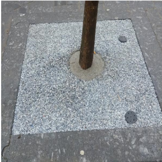
Stap 1 - Zorg voor een stabiele ondergrond voor een goed eindresultaat

Laat CityKrans aanbrengen door een door PVN geadviseerd bedrijf voor 5 jaar garantie tegen onkruid. Het product laat zich echter eenvoudig aanbrengen, zie onderstaande verkorte instructie. Voor een uitgebreide gebruiksaanwijzing of verwerkingsvoorschrift kunt u contact opnemen via www.pvnbestratingsvoegen.nl/contact .