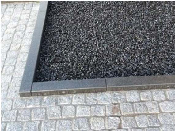
CityKrans als verharding, spatgrind etc

Gemengd met grind of keien wordt CityKrans gebruikt voor waterdoorlatende bekleding rond bomen of waterdoorlatende aaneengesloten bestrating voor voetgangersverkeer (3 cm. laagdikte) of autoverkeer (5 cm. laagdikte).