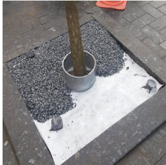
Stap 2 - Homogeen bindmiddel A en B mixen met schoon en droog grind