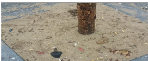
Voor behandeling met CityKrans