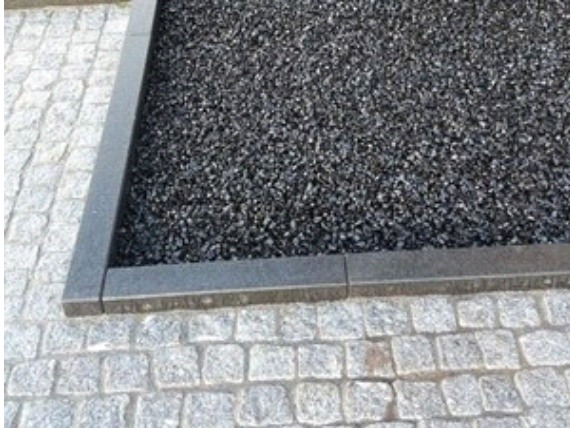
CityKrans als verharding, spatgrind etc

Gemengd met grind of keien wordt CityKrans gebruikt voor waterdoorlatende bekleding rond bomen of waterdoorlatende aaneengesloten bestrating voor voetgangersverkeer (3 cm. laagdikte) of autoverkeer (5 cm. laagdikte).