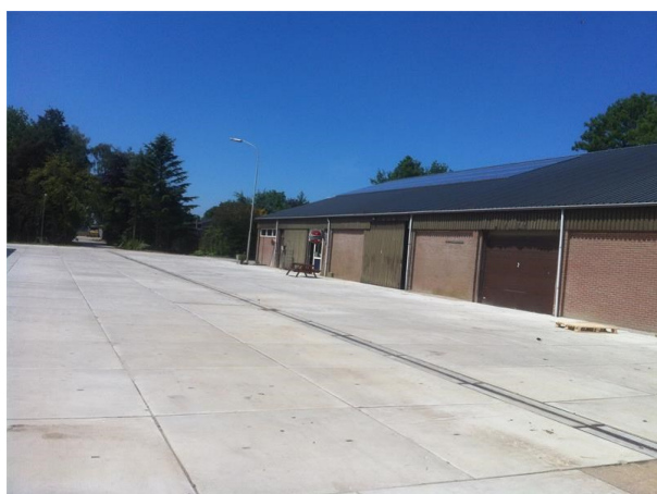
Siebenga-Langendoen te Swifterband