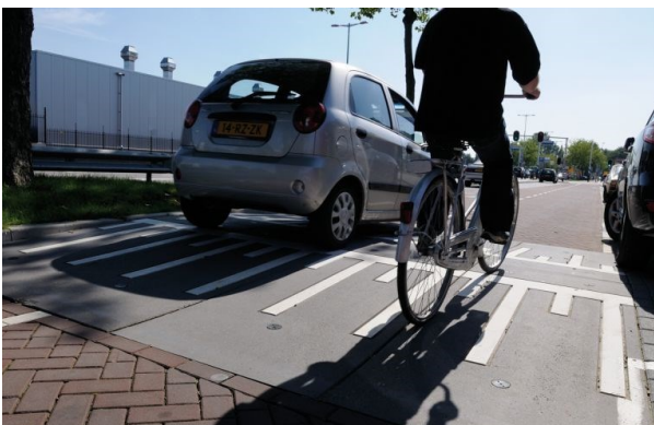
Drempels als verkeersremmende maatregel