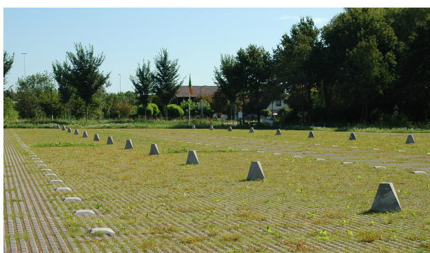
Bunnik, nationaal museum Hollandse Waterlinie (GS 62,5x37,5)