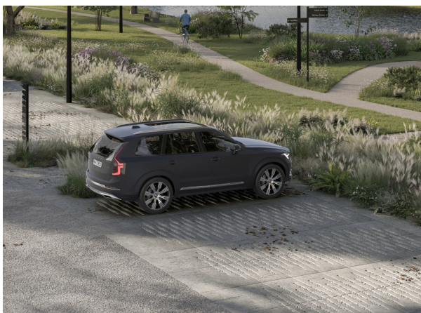
Grid Beach (voorbeeld 1)