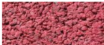
midden rood (..42)