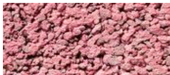
oud rose (..40)